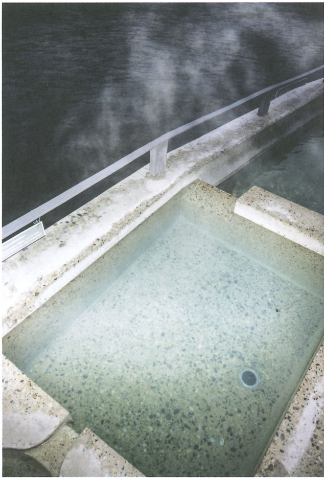
In die Brunnen fließt naturbelassenes Thermalwasser. Die Mineralien trüben das Wasser und lagern sich an den Beckenrändern ab.