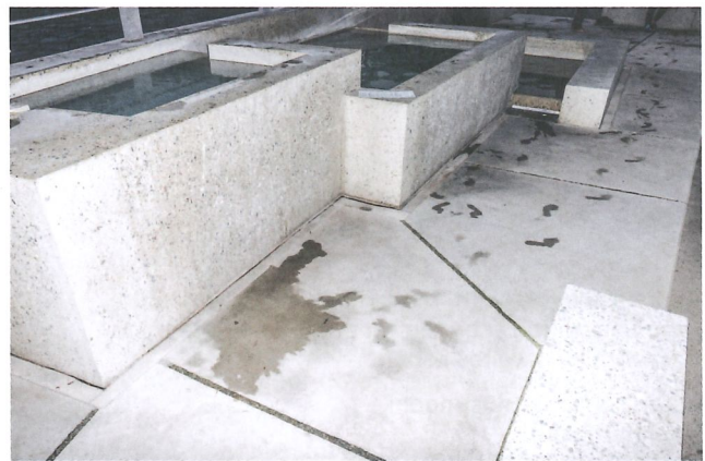
Die drei Becken des Badener Brunnens aus geschliffenem Beton.