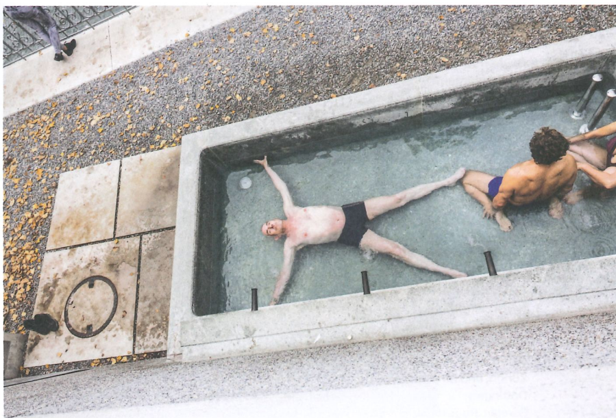
Schon während der Brunnen sich nach der Reinigung wieder füllt, entspannen die ersten Badegäste im noch flachen Wasser.