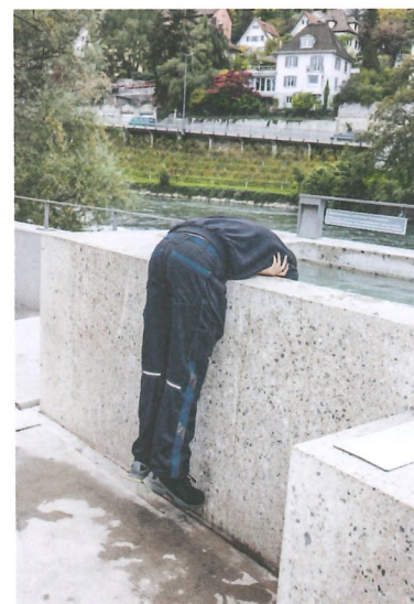
Die Reinigung erfolgt dreimal pro Woche und erfordert vollen Körpereinsatz.