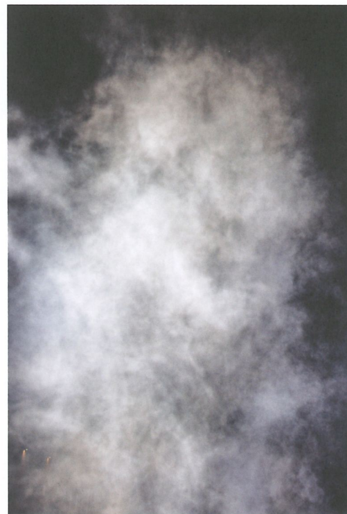
Gegen 22 Uhr löst sich die feuchtfrohliche Badegesellschaft in Luft auf.