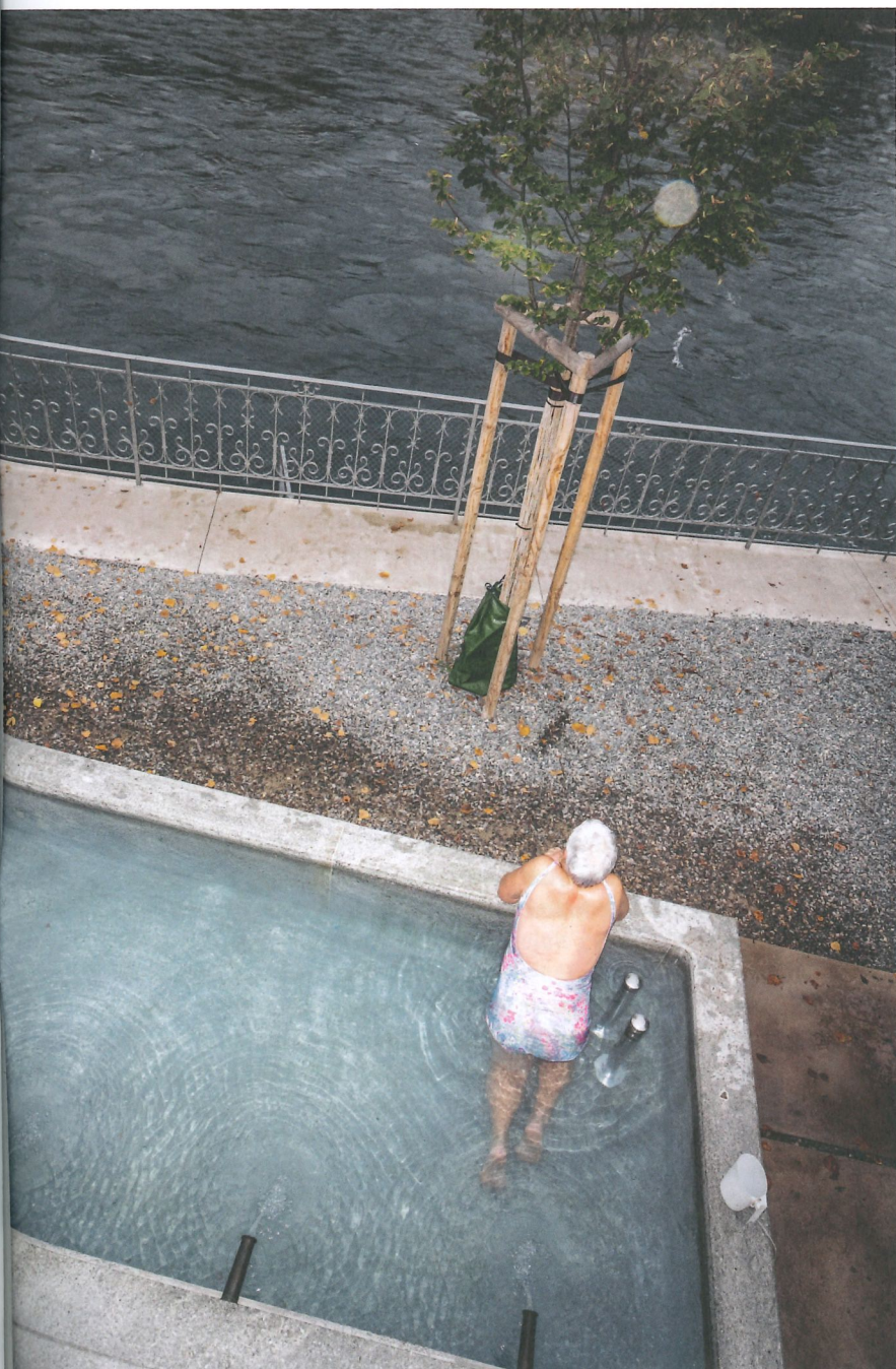
Der Brunnen in Ennetbaden besteht aus massivem Mägenwiler Muschelkalk.