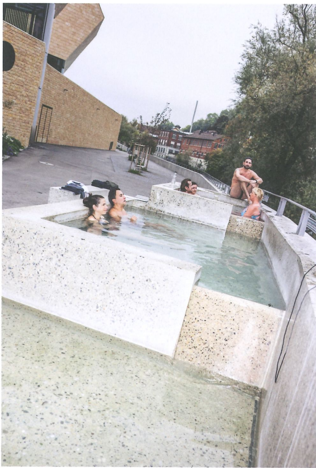
Öffentliche Badebecken gehörten in Baden jahrhundertlang zum Stadtbild. Dank dem Verein Bagni Popolari lebt die Tradition neu auf.