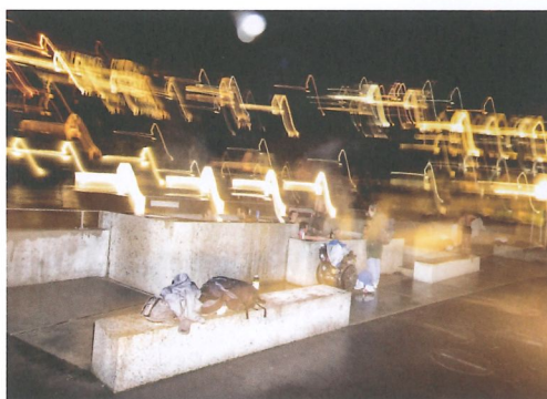
Ausgelassen, aber rücksichtsvoll: Die meisten Badegäste tragen den Brunnen und ihrer Umgebung Sorge.

Mitten in der Stadt im Badekleid in den warmen Brunnen sitzen: Was bis in die frühe Neuzeit selbstverständlich war, ist dank dem Verein Bagni Popolari und den Gemeinden Baden und Ennetbaden wieder möglich. Der radikale Ruf nach Wiederaneignung des öffentlichen Guts (in diesem Fall des Thermalwassers) hat sich gelohnt. Mit den «Heissen Brunnen» wurde ein Angebot geschaffen, das es so bis jetzt in der Schweiz nicht gab und das Schule machen könnte. Der Beitrag der Landschaftsarchitektur ist essenziell für das Gelingen des Orts, denn es musste eine Gestalt für die Idee des öffentlichen Bads gefunden werden. Die «Heissen Brunnen» zeigen, wie kollektives Engagement und gestalterischer Anspruch zu neuen öffentlichen Raumqualitäten führen können. Vielleicht wäre mehr «Bagno popolare» noch besser? Die Nutzung der Becken ist intensiv, ein extensiveres Aneignen des Limmatraums wäre wünschenswert. Das Projekt zeigt beispielhaft, dass Planungsaufgaben in der Landschaftsarchitektur selbst gestellt werden müssen.