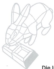
Die Jury sagt